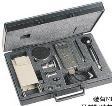
装有MIC 10 及其附件的提箱