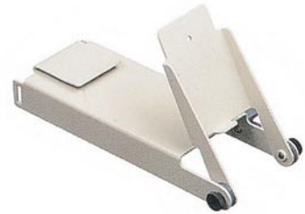
支持及定位装置 MIC 1040