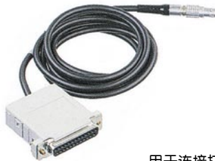
用于连接打印机和 电脑的串行数据电缆