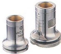
平面附件MIC 270 棱形附件MIC 271